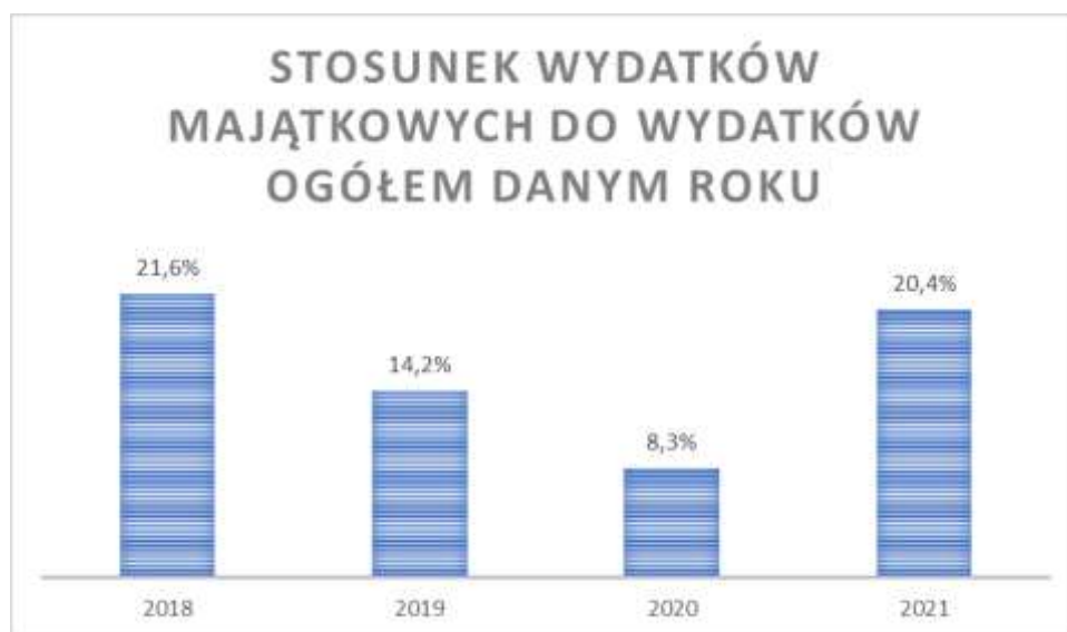
Wykres 1. Stosunek wydatków majątkowych do wydatków ogółem w latach 2018-2021

Źródło: Rb -NDS sprawozdanie o nadwyżce /deficycie jst za lata 2018-2021