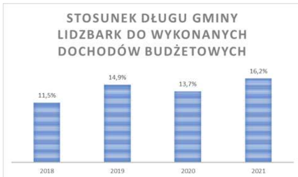
Wykres 2. Stosunek długu Gminy Lidzbark do wykonanych dochodów budżetowych w latach 2018-2021