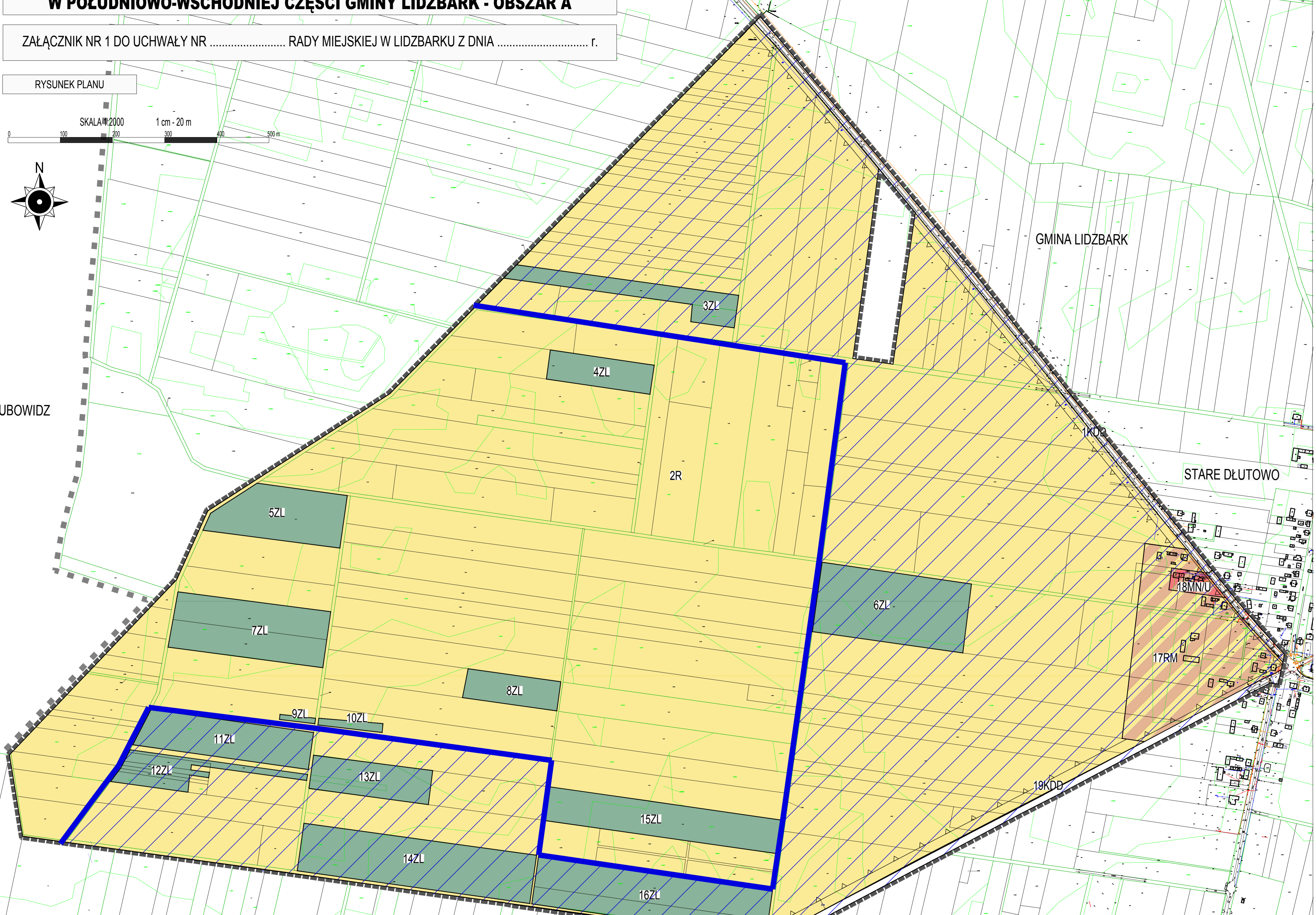
Wykres ze studium uwarunkowań i kierunków zagospodarowania przestrzennego w południowo-wschodniej części gminy Lidzbark - obszar A